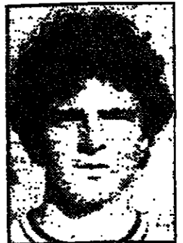
ابي كوهين اللاعب الممتاز من فريق مكابي تل ابيب الذي يلعب في صفوف فريق ليفربول البريطاني عاد الى البلاد الى صفوف المنتخب الاسرائيلي ليقوي خط الدفاع في لقاءه مع السويد .